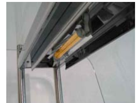
Licht- / Wärmestrahler

Holzdekore passen sich in Farbe und Struktur Ihrer Einrichtung an