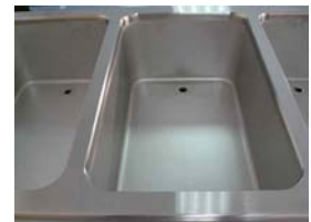
Bainmarie mit Becken 1/1 bis 3/1 GN