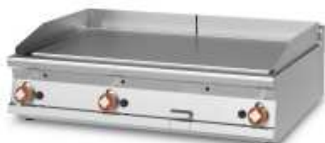
Bratplatten , Ausführungen GAS oder ELEKTRO glatt, geriffelt, hartverchromt oder glatt/geriffelt. In den Arbeitsbreiten 400, 800 und 1200mm