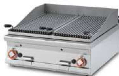
Lavaglühstein-Grill , Arbeitsbreite 400mm, 1 Rost 380x660mm Arbeitsbreite 800mm, 2 Roste à 380x660mm