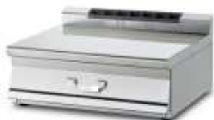
Arbeitsplatten , mit Schublade. In den Arbeitsbreiten 200 (ohne Schublade), 400, 600 und 800mm