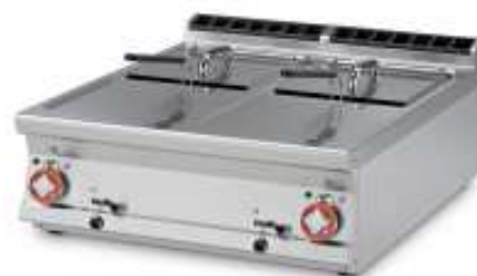
Fritteusen , Ausführung GAS oder ELEKTRO 1 Becken oder 2 Becken, 8 oder 13 Liter inkl. Fettfilter, Frittierkorb und Abdeckblech