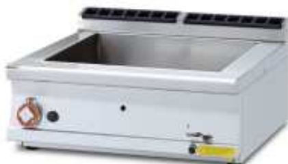
Bainmarie-Wasserbad Ausführung GAS oder ELEKTRO. Arbeitsbreite 400mm - GN 1/1 + GN 1/3 Arbeitsbreite 800mm - GN 2/1 + 2x GN 1/3