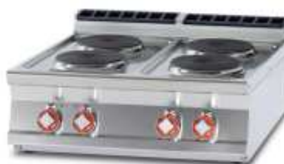
Elektro-Herde , 2, 4 oder 6 Kochplatten, runde oder eckige Ausführung In den Arbeitsbreiten 400, 800 und 1200mm